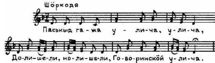
La mélodie populaire « Paškyd gaža ul'ica » (Osipov 1984).

Cinq symphonies sont à son catalogue. La Première 17 , qui a été composée dans le cadre de ses études au conservatoire de Gorki (Nižnij-Novgorod) 18 , est directement issue d'influences russes, avec des souvenirs de Prokofiev et Chostakovitch, mais elle se termine de façon spectaculaire par un grand jaillissement de mélodies populaires komies (« L'oisillon vermeil » 19 , « L'étoile du matin » 20 , et surtout des variations sur « Large et gaie la rue » 21 ). À Londres, la Deuxième (1996), plus jazzy, se rapproche de la musique de variétés, non sans humour. La Troisième (1996) explore un monde parallèle avec un goût pour la répétition et le collage qui, dans la Quatrième (1998) et la Cinquième (2002), se rapproche du minimalisme répétitif néotonal nordique et du collage, tels qu'on peut les trouver en Finlande ou en Estonie. Il est à noter que ces symphonies sont écrites pour synthétiseur et que le compositeur avoue qu'il lui semble actuellement impossible de les réorchestrer pour des instruments acoustiques.