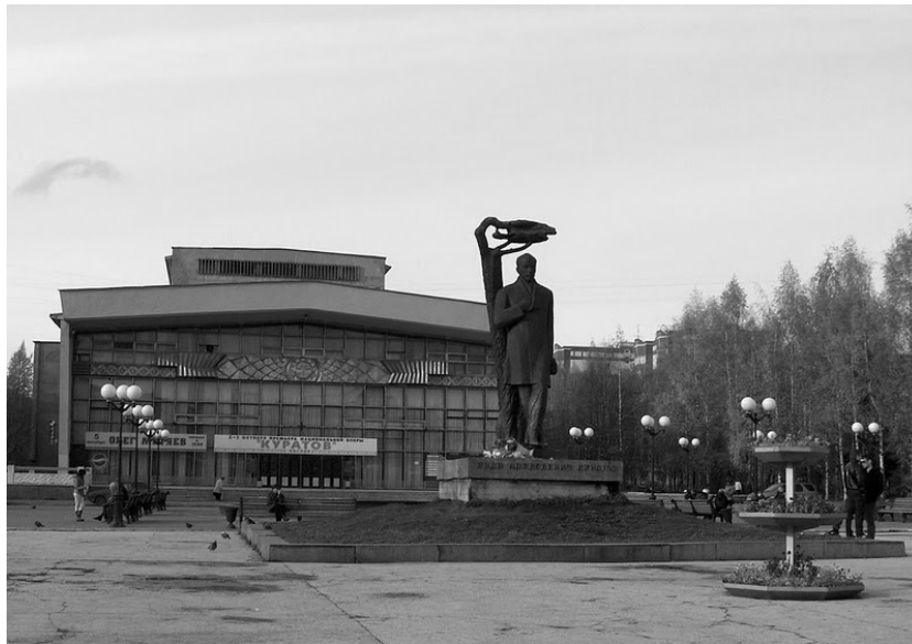
La statue de Kuratov devant l'Opéra en octobre 2009, avec la création annoncée sur la façade.

Comme point de départ, il fallait un sujet à forte portée idéologique, aussi symbolique en soi que le fait même de concevoir un opéra national komi. Pour cela, rien de tel qu'un « grand homme » du pays : et qui pourrait endosser cette fonction mieux qu'Ivan Kuratov 16 ? D'ailleurs, depuis 1977, sa statue en bronze orne le parvis de l'Opéra, en plein centre de Syktyvkar, le long de l'artère principale. Si l'on se fie à la grandeur et à la situation des monuments de la capitale, Kuratov apparaît donc comme le deuxième « grand homme » de l'État komi – après Lénine, sur la place centrale.